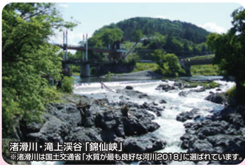
渚滑川・滝上渓谷「錦仙峡」 ※渚滑川は国土交通省「水質が最も良好な河川2018」に選ばれています。