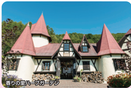
香りの里ハーブガーデン