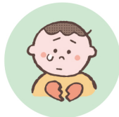
こどもの心や自尊心を傷つけるような言動をしたり、繰り返し言うこと