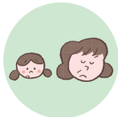
こどもを無視したり、拒否的な態度を示すこと