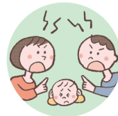
配偶者への暴力や暴言をこどもに見せること