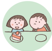
他のきょうだいとは著しく差別的な扱いをすること