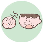
言葉で脅したり、脅迫すること

体罰は暴力でこどもの身体を傷つけるもので、心理的虐待は暴言などでこどもの心に深い傷を負わせるものです。こども本人への暴言でなくとも、配偶者や家族に対する強い言葉などもこどもの心を傷つけ、発達に影響する可能性があります。