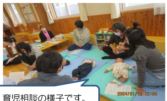
育児相談の様子です。