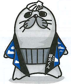
紋別の ご当地キャラ「紋太もんた」