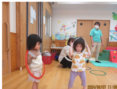
フープを頭から・・・