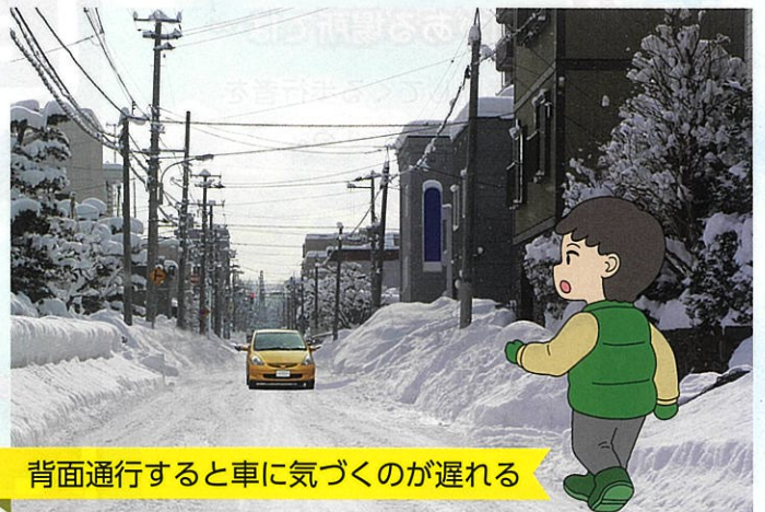
背面通行すると車に気づくのが遅れる