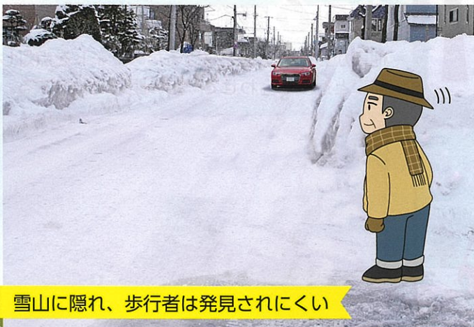
雪山に隠れ、歩行者は発見されにくい