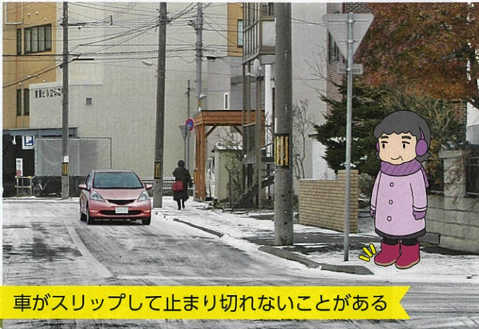
車がスリップして止まり切れないことがある