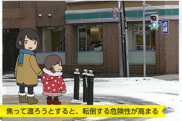
焦って渡ろうとすると、転倒する危険性が高まる