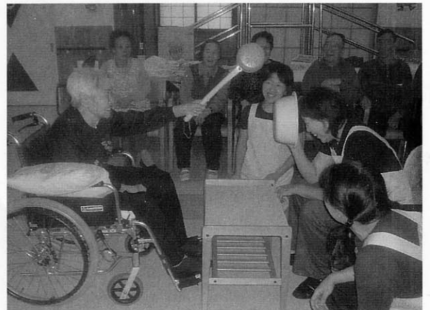
デイサービスセンターでのレクリエーション ～みんなでいろんなゲームもします。

利用1回あたりの食費負担額 39円が250円に改正されます。これは、食費の負担が介護保険の対象外となったことによるもので、食費のうち食材料費にかかる費用を負担していただくものです。