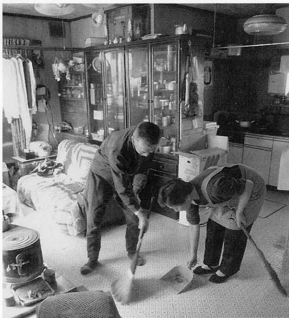
ホームヘルパーさんと一緒にお掃除中

介護予防の対象者は「要支援1・2」の方という話はしましたが、その場合何が変わるのかというと、「介護予防」のサービスは、デイサービスや介護ヘルパーさんに「全ておまかせ」するのではなく「できるところは自分でやる、できることを増やす」という考え方でサービスを提供することになります。この考え方のもとに、利用される方は引き続き今までのようなサービスを受けることができます、ご安心ください。