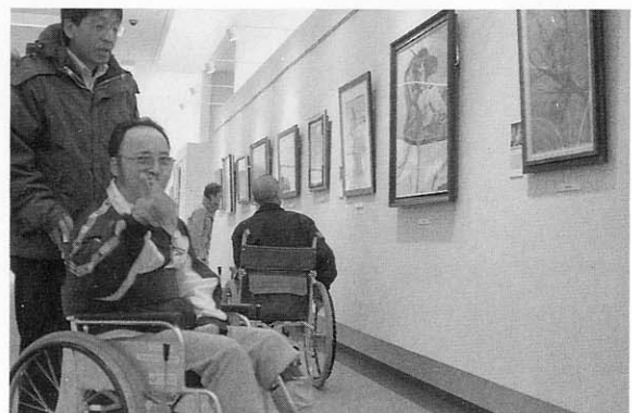
○1月31日 利用者6名が紋別市博物館「口と足で描く芸術展」鑑賞。