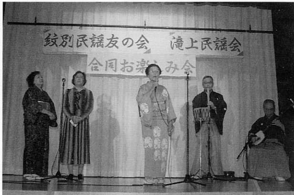
○3月26日 紋別民謡友の会・滝上民謡会による合同お楽しみ会。