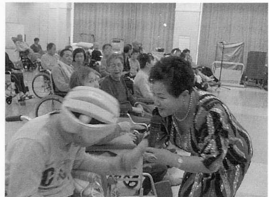
○3月14日 白波歌遊会による歌謡ショーを実施