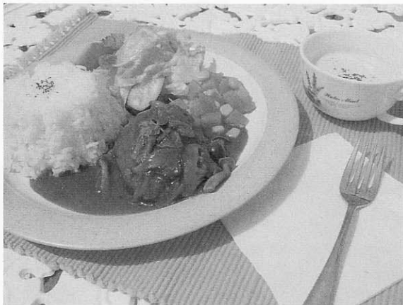
イチオシ！オホーツクハマナス牛ハンバーグ